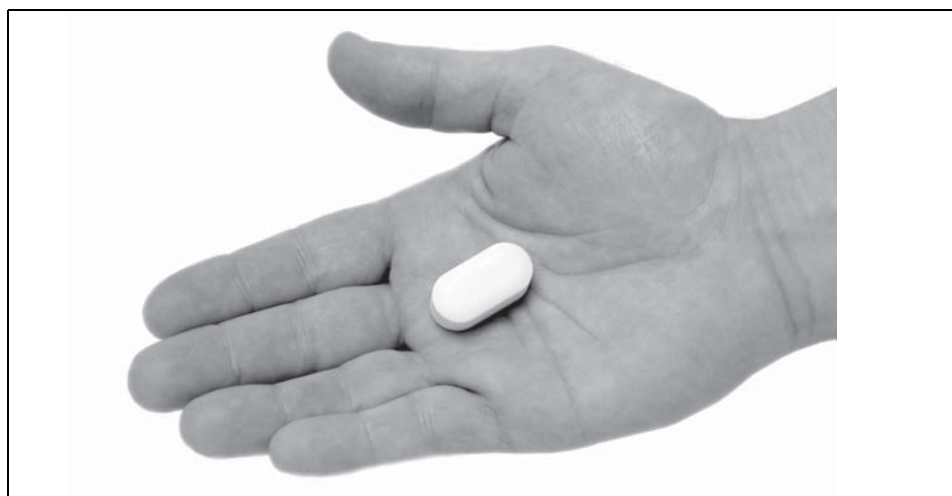
Abb. 1. Bi-PILL®. Natriumbikarbonat-Pille. Bi-PILL®. Sodium bicarbonate pill.

Die Untersuchung fand in einem Brandenburger Rinderzuchtbetrieb statt. Der Betrieb war ausgewählt worden, weil dort ausreichend viele Kühe vorhanden waren, um die